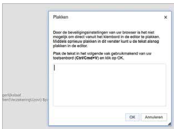
Figuur 2 Bij het plakken van de afbeelding verschijnt soms het scherm Plakken

op ctrl-C ('kopiëren naar het klembord').