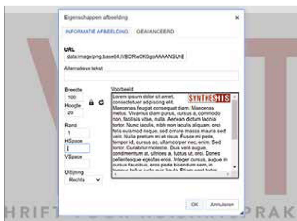
Figuur 3. Het aanpassen van eigenschappen

Stap 5: De afbeelding is nu ingevoegd in het sjabloon,